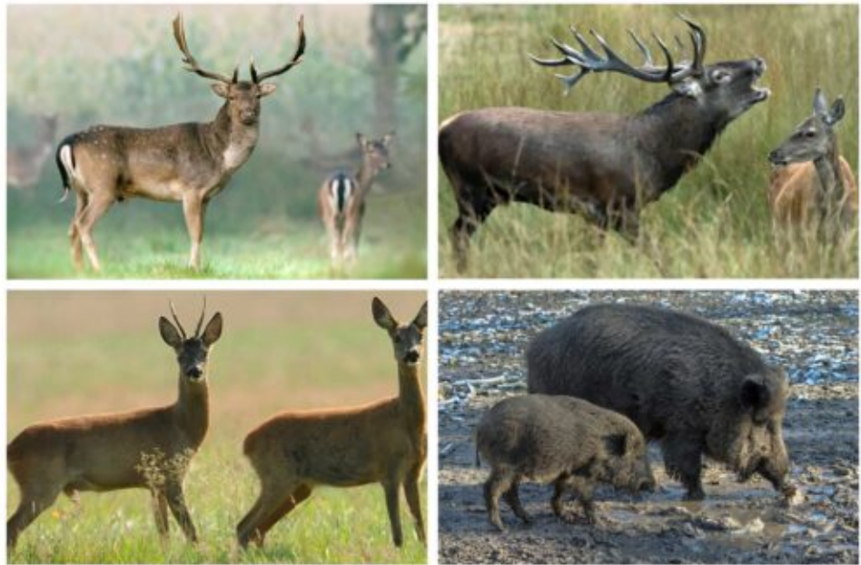
grofwild soorten in Nederland