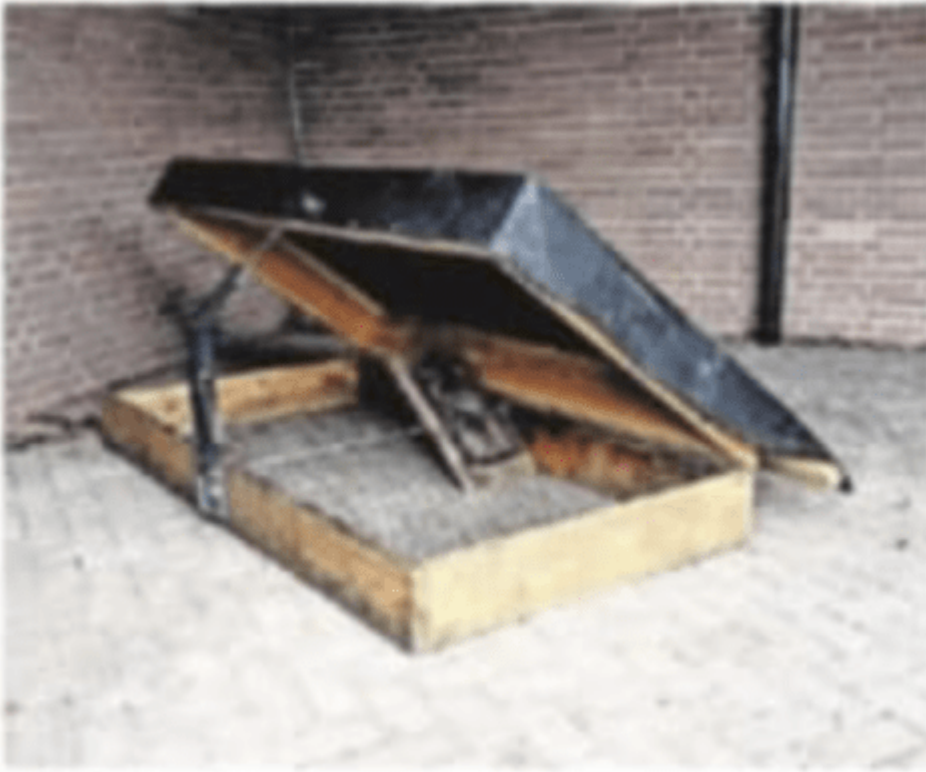
▲ De inbeslaggenomen val.